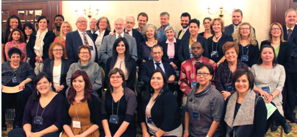
Les 40 lauréates et lauréats lors de la cérémonie du 10 décembre 2015.